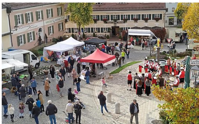
So schön war der Fastenmarkt im vergangenen Jahr.

Für das leibliche Wohl ist ausreichend gesorgt. Von Gegrilltem aus Fleisch, Wurst, Geflügel und Fisch über Döner Kebap und ungarischen Spezialitäten bis hin zu Backwaren und Kaffeeständen und Süßem ist alles geboten. Gewürze, Feinkost