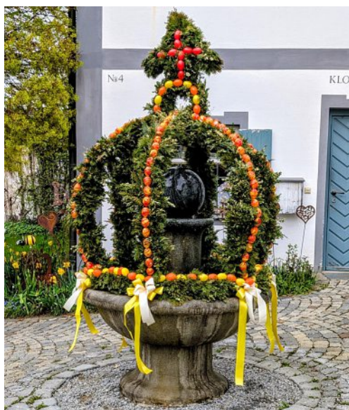
Einen sehr schönen Osterbrunnen haben die Damen vom Klosterladen wieder im Althof geschmückt, der alle Jahre zu einem Blickfang wird.